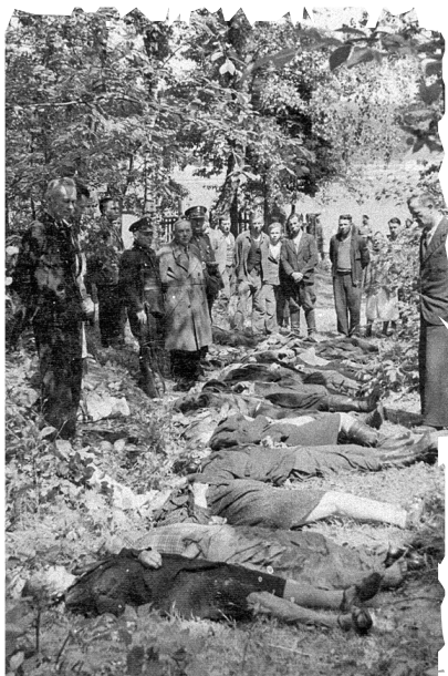
■ Ofiary napadu na pociąg pod Zatyłem (k. Lubyczy Królewskiej) dokonany 16 czerwca 1944 r. przez UPA. KARTA

Tragiczne wydarzenia 1943 r. na Wołyniu miały istotny wpływ na rozwój polskiego ruchu partyzanckiego, w tym powstanie największej jednostki partyzanckiej w okresie okupacji – 27 Wołyńskiej Dywizji Piechoty Armii Krajowej. Dywizja, która