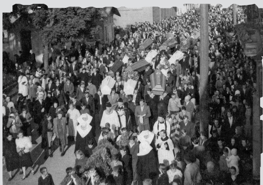
■ Pogrzeb ofiar napadu na pociąg pod Zatyłem

Ludobójstwo jest kategorią prawną. Zbrodnia Wołyńska wyczerpuje jego znamiona, zgodnie z konwencją ONZ w sprawie zapobiegania i karania zbrodni ludobójstwa z 1948 r. Definiuje ona ludobójstwo jako czyn „dokonany w zamiarze zniszczenia w całości lub części grup narodowych, etnicznych, rasowych lub religijnych, jako takich”. W nauce polskiej Zbrodnia Wołyńska jest określana mianem ludobójczej czystki etnicznej, zbrodni lub rzezi wołyńskiej (bądź wołyńsko-galicyskiej) lub – przy użyciu terminologii prawniczej – zbrodni ludobójstwa. Nie przesądzając, która z tych kwalifikacji Zbrodni Wołyńskiej jest najważniejsza, można przyjąć za pewne, że dokonana