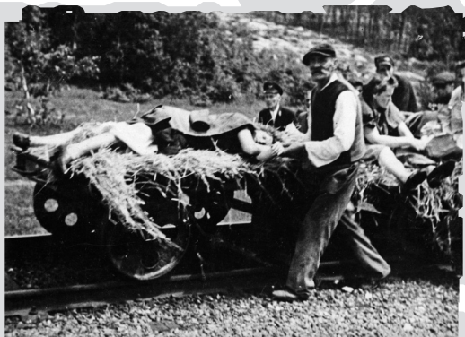
■ Ofiary napadu na pociąg pod Zatyłem (k. Lubyicy Królewskiej) dokonany 16 czerwca 1944 r. przez UPA.