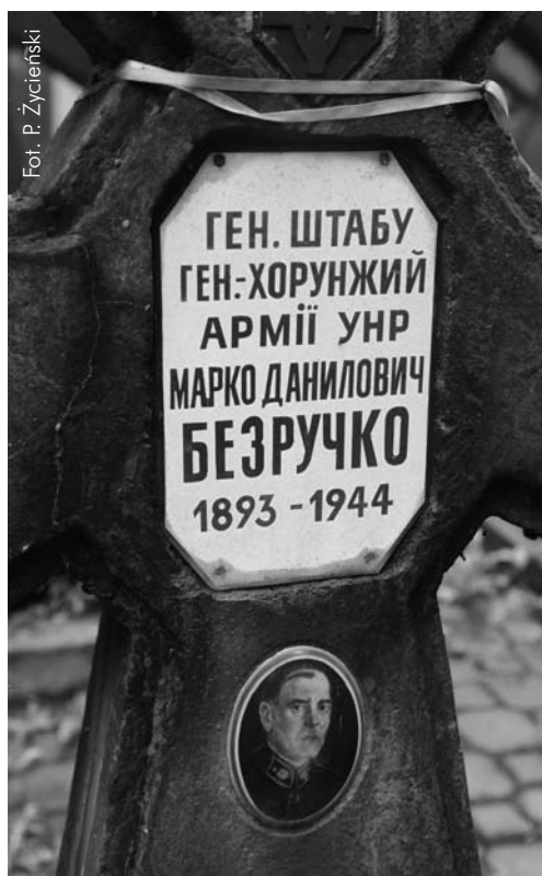
Nagrobek na cmentarzu prawosławnym na warszawskiej Woli

Na przełomie października i listopada 1920 r., w następstwie przeprowadzenia kolejnej mobilizacji na zajmowanych terenach, według ocen strony polskiej armia URL liczyła ok. 40 tys. ludzi, w tym jednak zdolnych do walki było tylko ok. 10,5 tys. żołnierzy uzbrojonych w 83 działa i 402 KM 27 . Już po zawarciu rozejmu z bolszewikami strona polska, łamiąc przyjęte zobowiązania, nadal przysyłała do swego byłego sojusznika przede wszystkim uzbrojenie i zaopatrzenie. W ten sposób chciała lepiej przygotować go do dalszej samotnej walki z przeważającymi siłami sowieckimi. Dla przykładu, tylko od 15 października do 15 listopada 1920 r. przekazano Ukraińcom m.in.: 6 ton sucharów, 6 ton siana oraz ponad