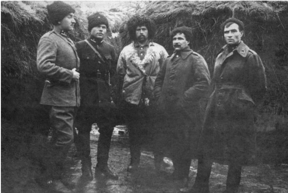
Oficerowie armii URL gen. M. Omelanowycza-Pawlenki, jesień 1920 r.

wie decyzji polskich władz wojskowych oficerowie ukraińscy otrzymywali pobory i dodatki takie same, jakie przysługiwały oficerom Wojska Polskiego (żołnierze podobnie). Zasada ta obowiązywała od 10 lutego 1920 r. Jak podają źródła polskie, tylko do 10 marca Ministerstwo Spraw Wojskowych wydatkowało kwotę 18 mln marek polskich, którą przeznaczono na pokrycie kosztów związanych z organizacją i utrzymaniem formującej się dywizji ukraińskiej w Brześciu 13 . W następnych tygodniach koszty te uległy znacznemu zwiększeniu.