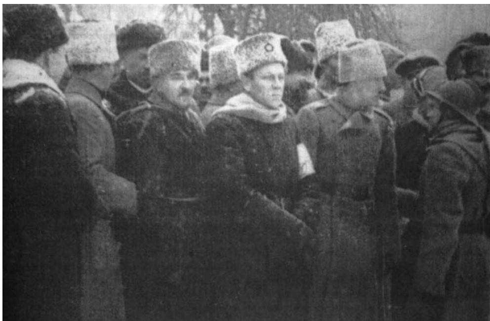
Symon Petlura (w środku z opaską na ręce) dokonuje przeglądu armii URL, grudzień 1918 r.

łem dotarł do Brześcia (z Łotwy) także na początku marca. W okresie wspólnego pobytu w Brześciu około dwustu żołnierzy gen. Bałachowicza przeszło do formującej się 6. Dywizji Ukraińskiej. Ukraińcy stanowili zresztą w jego oddziale, liczącym wówczas tylko 893 osoby, drugą co do wielkości grupę narodowościową. Stanowiła ona 23 proc. całego stanu formacji gen. Bałachowicza, Rosjan było w niej 41 proc., a Białorusinów 21 proc. 10