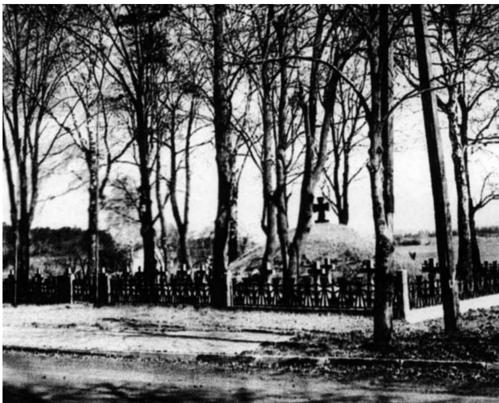
Cmentarz obozu internowanych żołnierzy armii URL w Aleksandrowie Kujawskim (stan przedwojenny)

wych lokatorów. Między innymi po dotarciu do Aleksandrowa Kujawskiego Ukraińcy musieli sami przystąpić do prac remontowych i porządkowych w obozie 33 .