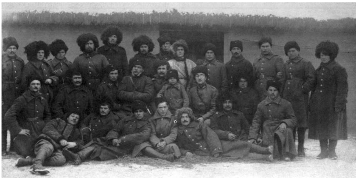
Żołnierze URL w polskich mundurach, jesień 1920 r.